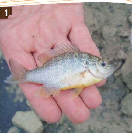
1 Percasol ( Lepomis gibbosus ) - 2 Cangrejo rojo ( Procambarus clarkii ) - 3 Mejillón cebra ( Dreissena polymorpha ) - 4 Almeja asiática ( Corbicula fluminea ) - 5 Lucio ( Esox lucius ) - 6 Siluro ( Silurus glanis )

El mejillón cebra es una especie invasora más, ya sea su llegada fortuita, introducida o por dispersión desde otras regiones. Como también lo son otras especies como el visón americano, el cangrejo rojo y el cangrejo señal, las cotorras argentinas y el galápago de Florida; también una gran variedad de las especies piscícolas (lucio, alburno, pez gato, siluro, black-bass...) y otros moluscos como la almeja asiática ( Corbicula fluminea ).