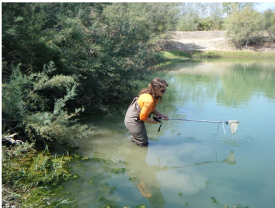
Toma de muestras de invertebrados bentónicos