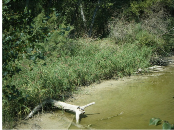
Imagen de la vegetación en la zona litoral