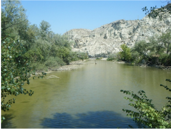
Vista del galacho